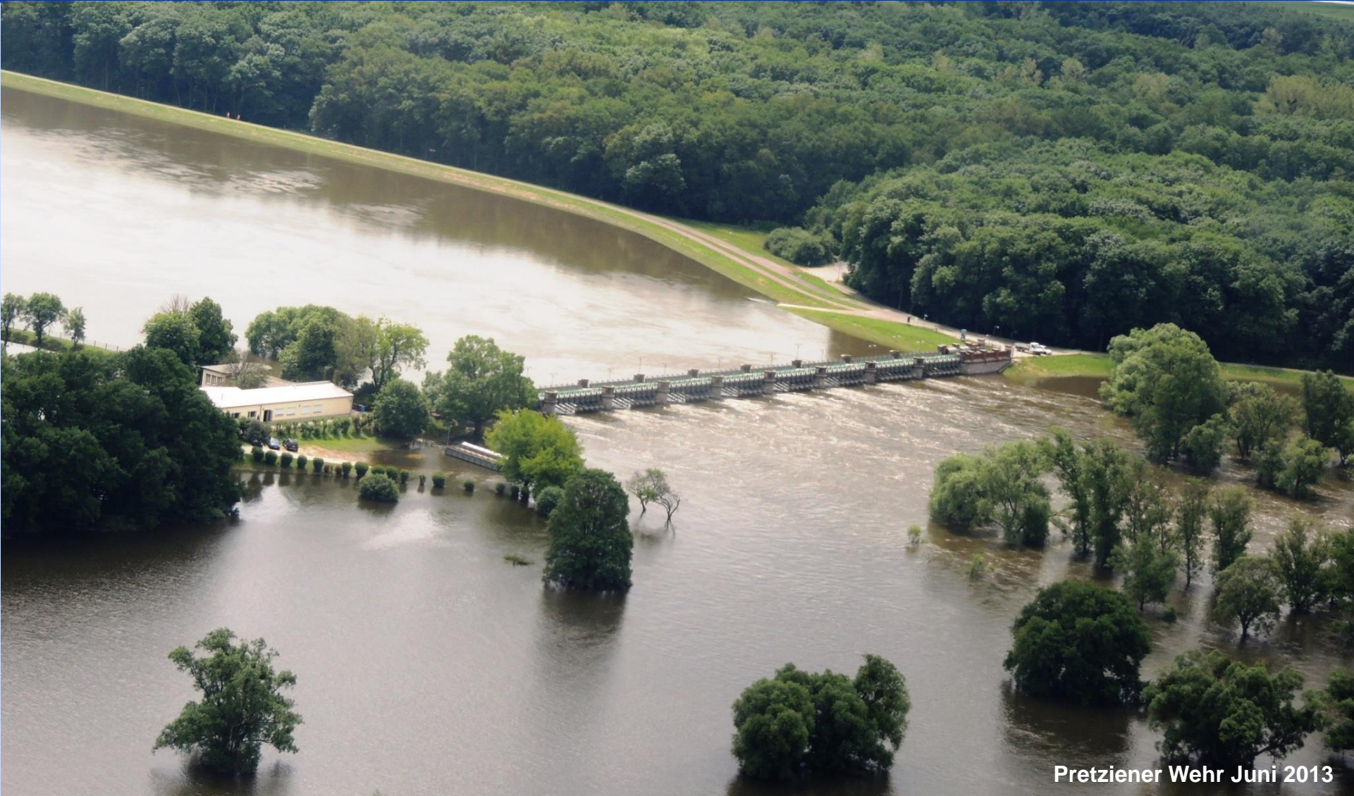
Pretziener Wehr Juni 2013