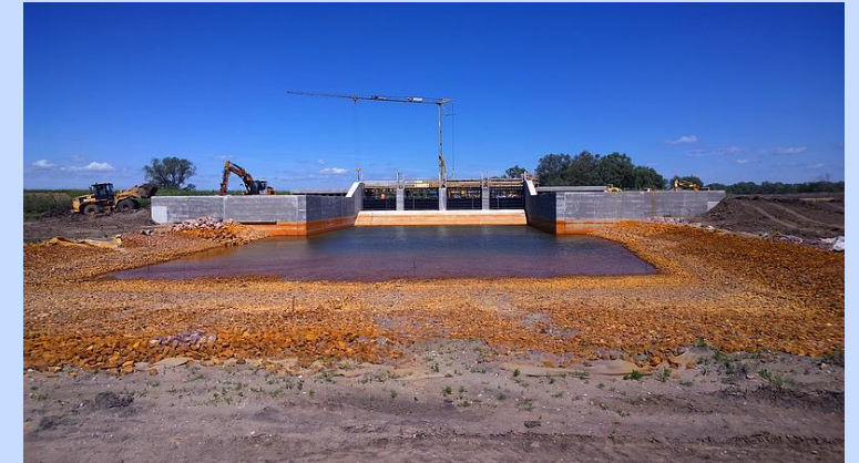
Guter Baufortschritt, Fertigstellung bis Ende 2017 möglich