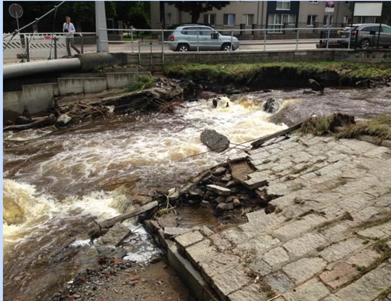
Weggerissenes Wehr in Wernigerode, Holtemme