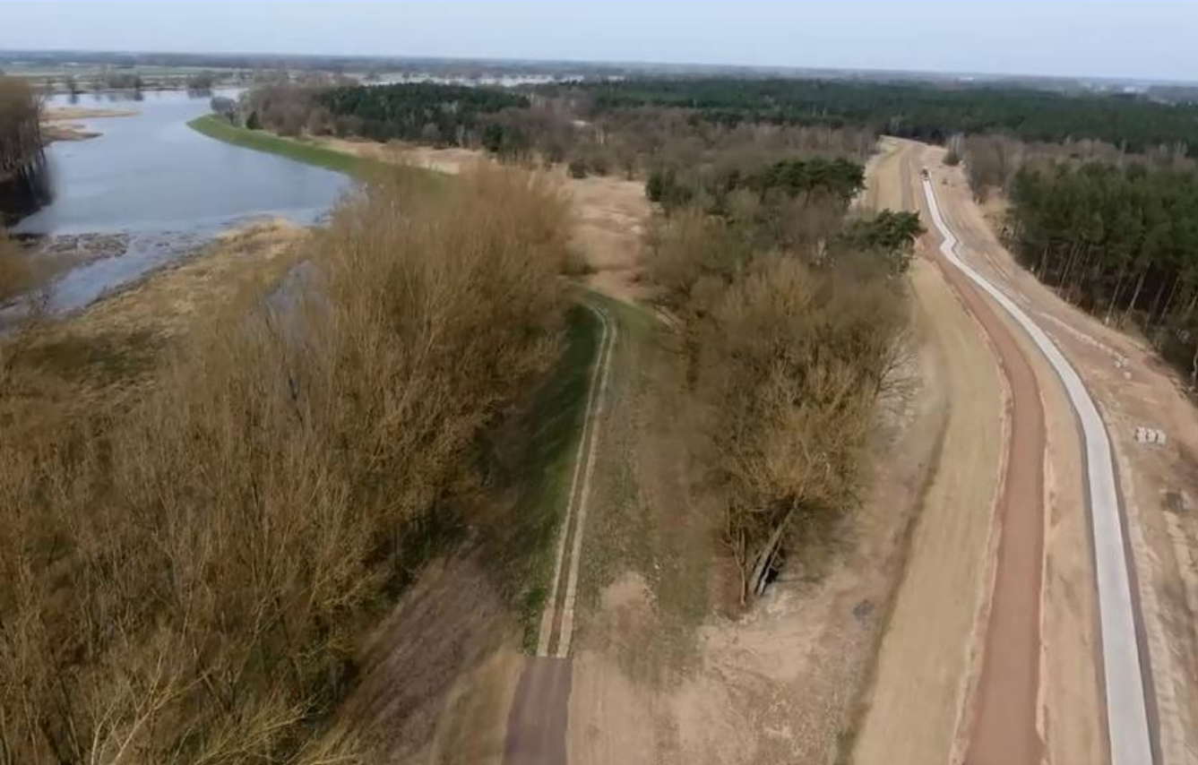
DRV Sandau Nord – Altdeich und Trasse der DRV März 2017